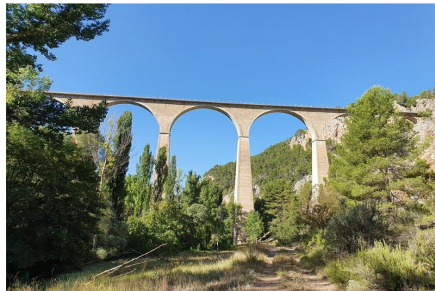
Puente Villa Paz

El final de nuestro camino de ida es un puente, con nombre Villa Paz, de la línea Valencia Cuenca Madrid. Fue construido en 1932 y está formado por cinco grandes arcos con un sexto de menor tamaño. Su visión nos permitirá presumir de ser sucesores de los que lo proyectaron y construyeron, nos servirá para