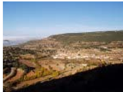
La Puebla de San Miguel

Pincha aquí para descargar los tracks en formato plt o wpt