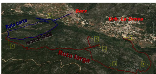
1. Font de la Drova 2. Forat de l'Aire 3. Pla de Simetes 4. Sima 5. Cim d'Aldaia 6. Nevera 7. Font de la Benita