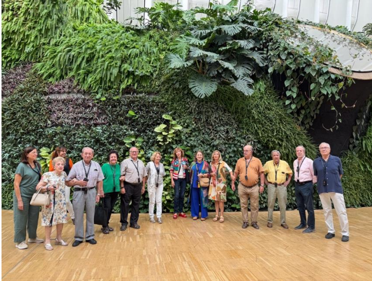
El primer grupo frente al jardín vertical.